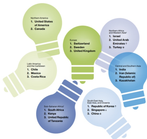
Fig. 2 Ranking de Innovación por Región

En los últimos años, se evidencia un avance en las iniciativas de innovación en el sector público en varios países de Norte América, Europa, Asia, África, Asia y América Latina, que han instalado una cultura de innovación en la gestión de los gobiernos locales promovida y apoyada por el Gobierno Central. Según el último reporte del Global Innovation Index 2021, las 03 primeras economías en innovación en América Latina son Chile, México y Costa Rica.