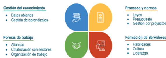
Fig. 3 Alcance de la Innovación Pública

Para lograrlo, el Observatorio de Innovación Pública de la OECD propone el trabajo en 4 frentes: